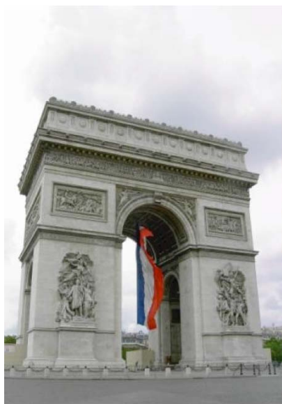
Khải Hoàn Môn