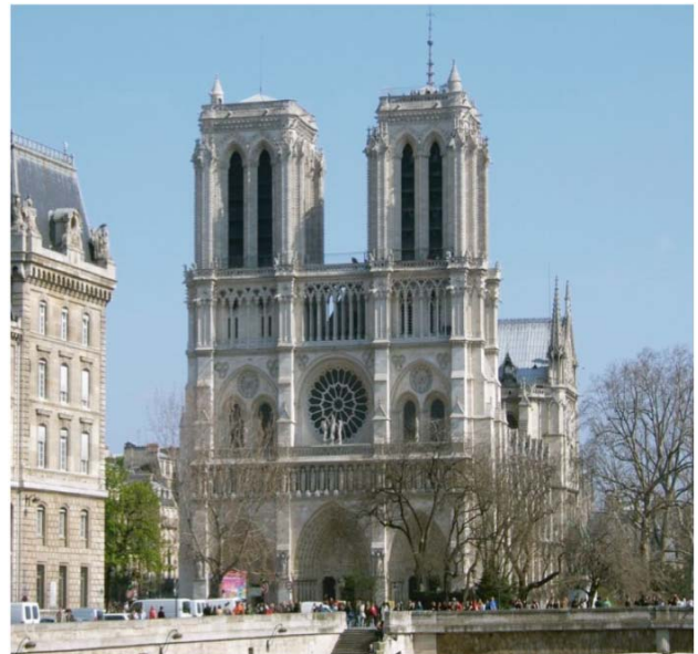
Nhà thờ Đức Bà Notre-Dame bên dòng sông Seine