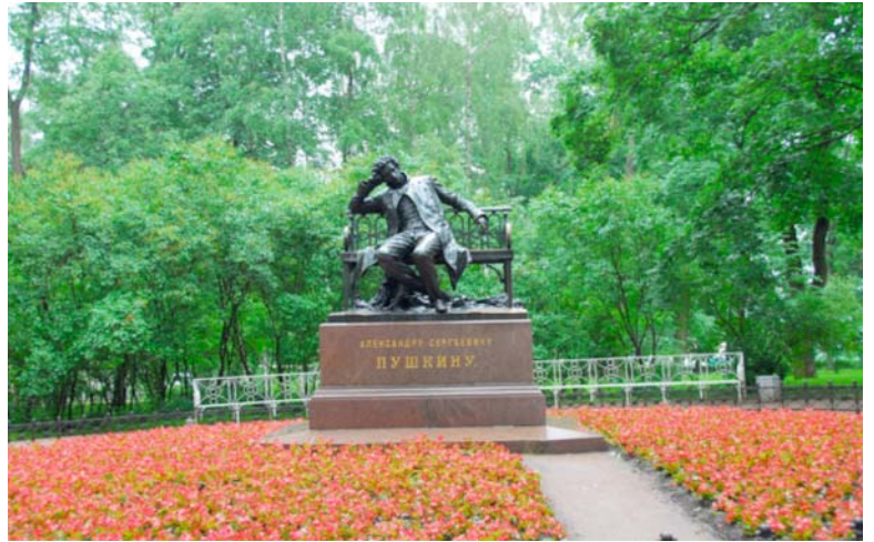
Làng thơ Pushkin tại cố đô Saint Petersburg