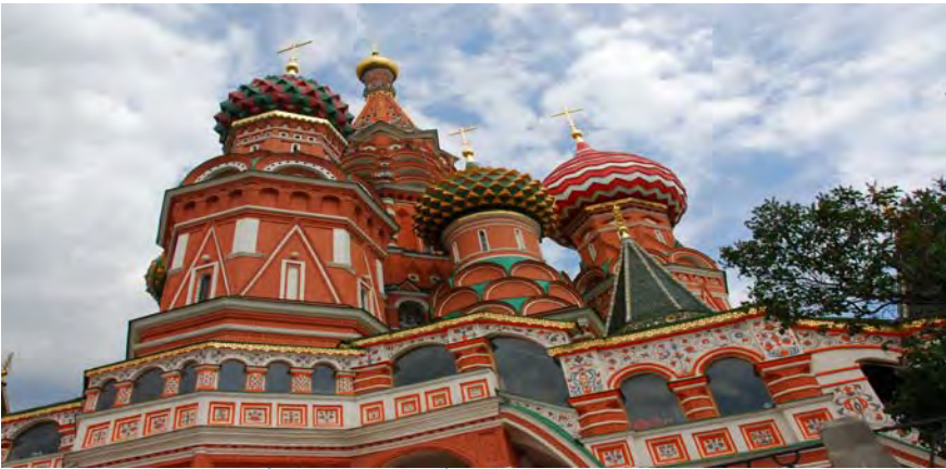
Tour đi vào thời điểm những đêm trắng ( White Nights) tại Sant Petersburg

(12 ngày / 10 đêm) Fly with British Airways one of the best airlines in the world